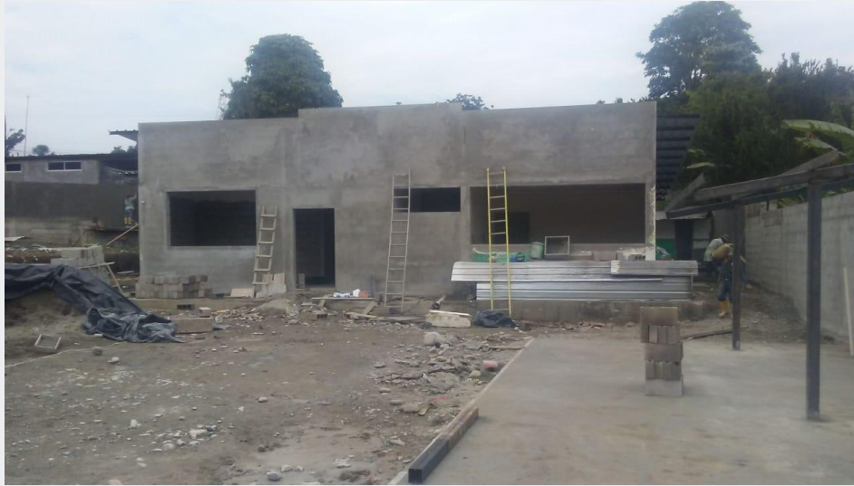
REPOTENCIACIÓN SSC JUAN SHIGUANGO