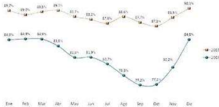
Gráfico 1: Disponibilidad de fármacos en establecimientos de salud

Fuente: IESSPR Elaboración: Subdirección Nacional de Seguimiento y Evaluación - DNPL