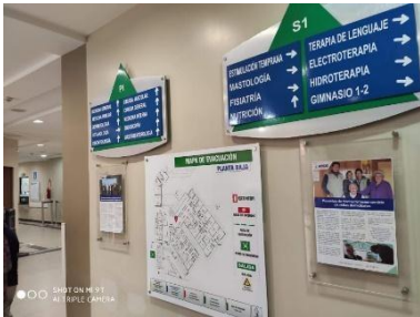
Imagen 23, planta baja Autor Carlos Monge Encargado de Comunicación