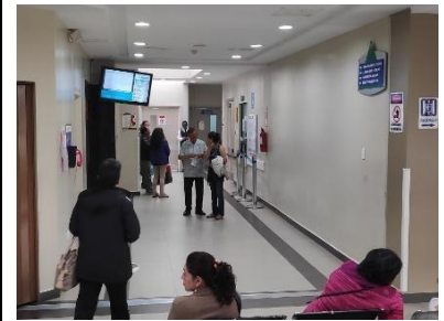
Imagen 24, planta baja Autor Carlos Monge Encargado de Comunicación