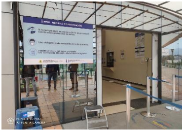
Imagen 25, exteriores