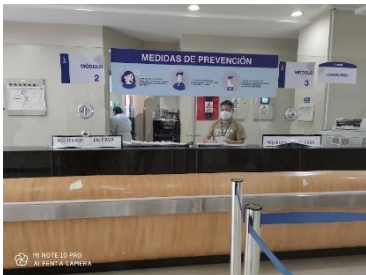
Imagen 27, planta baja Autor Carlos Monge Encargado de Comunicación