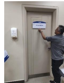
Imagen 28, área administrativa Autor Carlos Monge Encargado de Comunicación