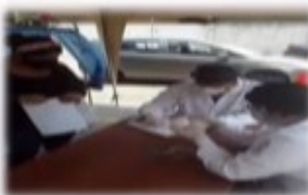
Toma de muestras de laboratorio a Domicilio