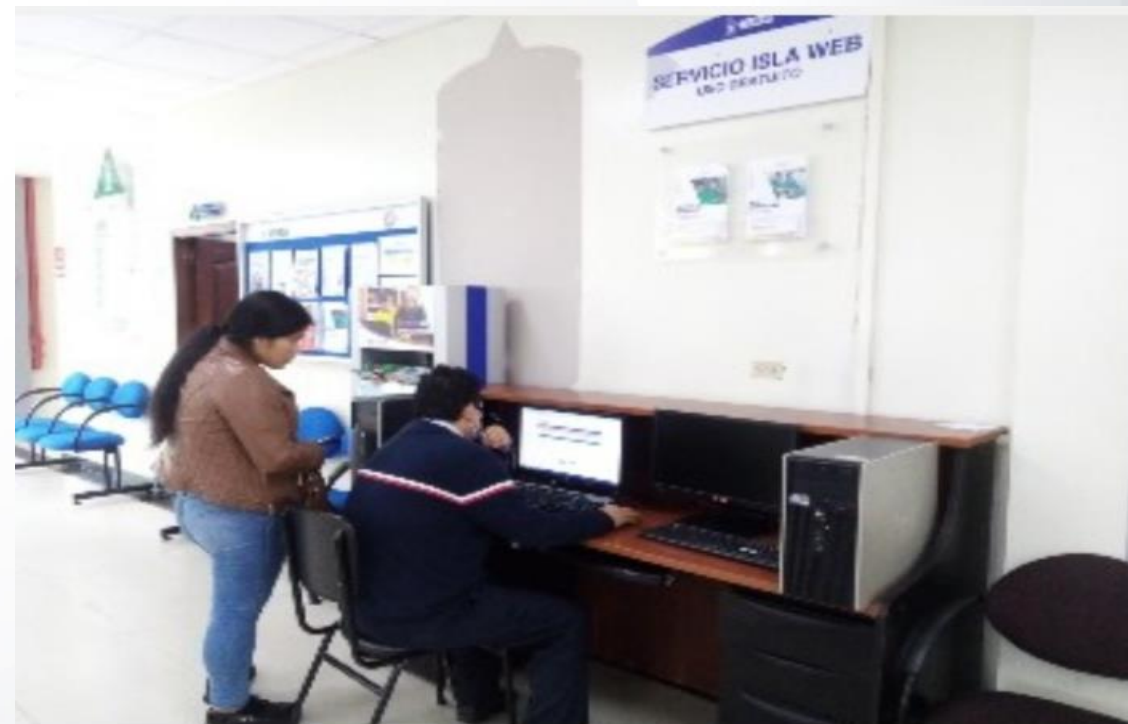
INCORPORACIÓN AL SERVICIO DE LOS ASEGURADOS DE ISLA WEB