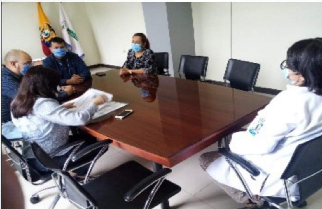
CONVENIO DE PRESTACIÓN DE SERVICIOS EXTERNOS DE CLÍNICA DE DIÁLISIS