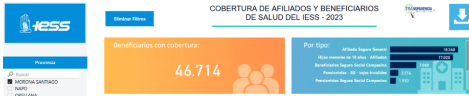
Gráfico 4. Cobertura de afiliados y beneficiarios de salud del IESS – 2023, Morona Santiago