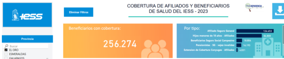
Gráfico 5. Cobertura de afiliados y beneficiarios de salud del IESS – 2023, El Oro