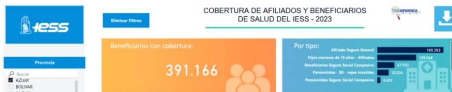
Gráfico 2. Cobertura de afiliados y beneficiarios de salud del IESS – 2023, Azuay