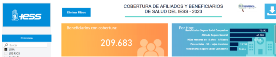
Gráfico 6. Cobertura de afiliados y beneficiarios de salud del IESS – 2023, Loja