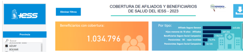
Gráfico 1. Cobertura de afiliados y beneficiarios de salud del IESS – 2023, Zonas 6 y 7

Fuente: Visor “Cobertura de afiliados y beneficiarios de salud del IESS - 2023”