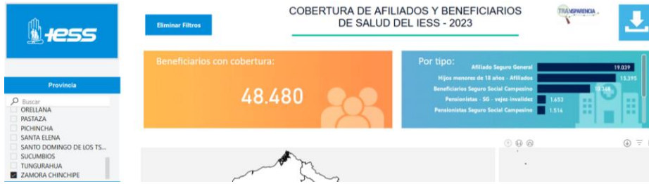
Gráfico 7. Cobertura de afiliados y beneficiarios de salud del IESS – 2023, Zamora Chinchipe