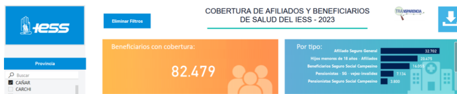
Gráfico 3. Cobertura de afiliados y beneficiarios de salud del IESS – 2023, Cañar