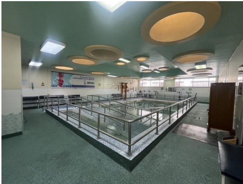
Gráfico 4. Mantenimiento de la piscina para tratamiento de rehabilitación física, efectuado en 2023