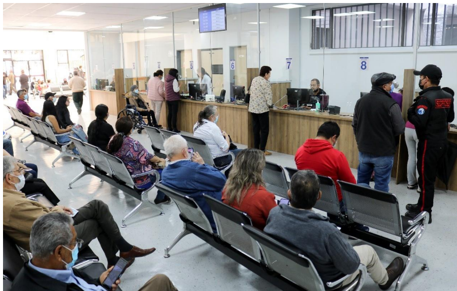
Gráfico 3. Nuevo Centro de Atención Universal – CAU del Hospital de Especialidades “José Carrasco Arteaga”, adecuado en 2023