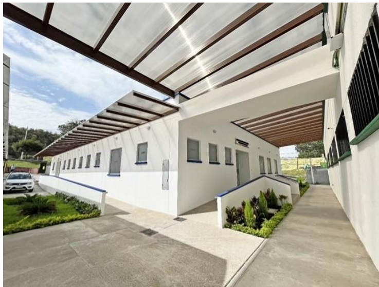
Gráfico 2. Nuevo Centro de Gastroenterología “Dr. César Bolívar Andrade Cantos” del Hospital de Especialidades “José Carrasco Arteaga”, construido en 2023