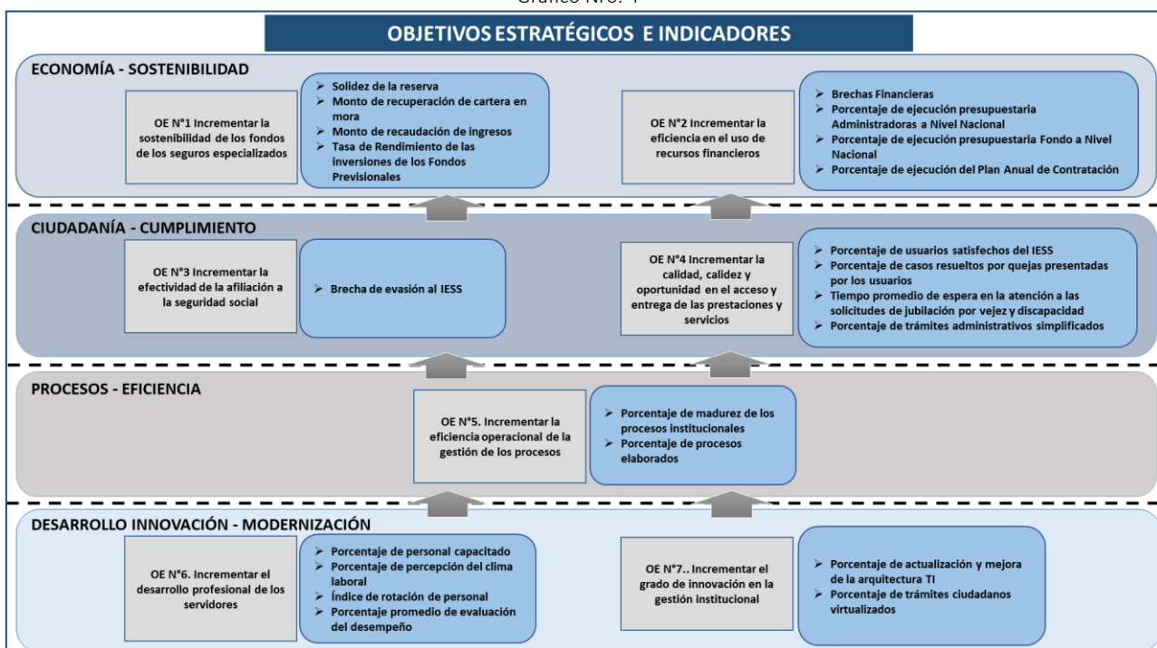
Gráfico Nro. 4

Elaborado por: Subdirección Nacional de Programación y Proyectos