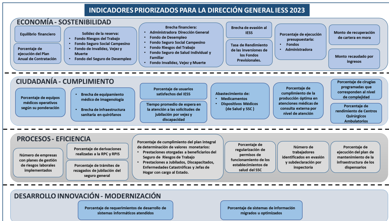
Gráfico Nro. 5

Elaborado por: Subdirección Nacional de Programación y Proyectos