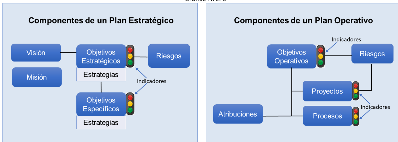
Gráfico Nro. 3

Elaborado por: Subdirección Nacional de Programación y Proyectos