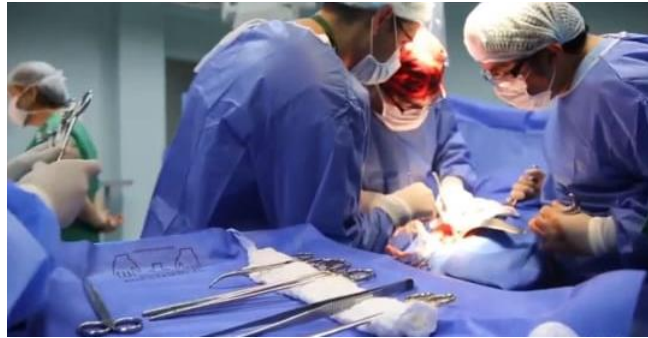
Elaboración: Hospital Teodoro Maldonado Carbo