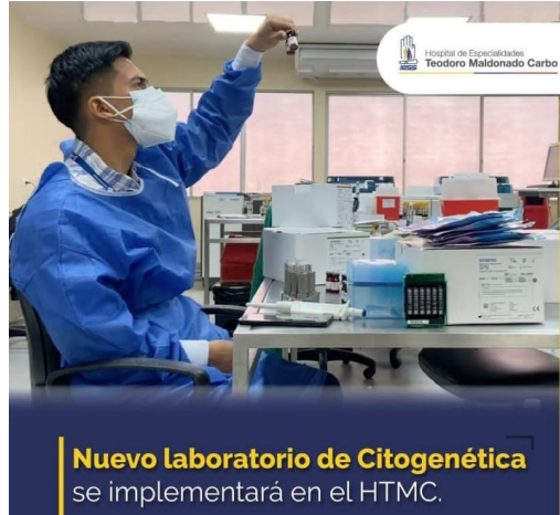
Ilustración Nro. 3 Laboratorio de citogenética