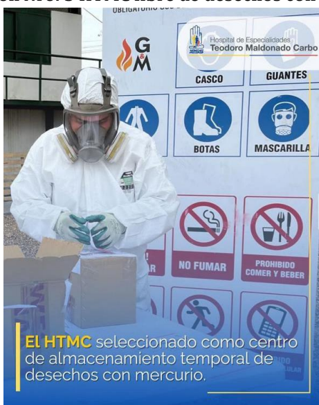
Elaboración: Hospital Teodoro Maldonado Carbo