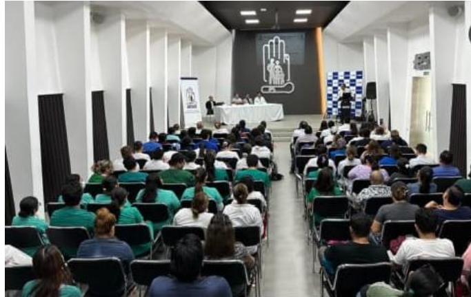
Elaboración: Hospital Teodoro Maldonado Carbo