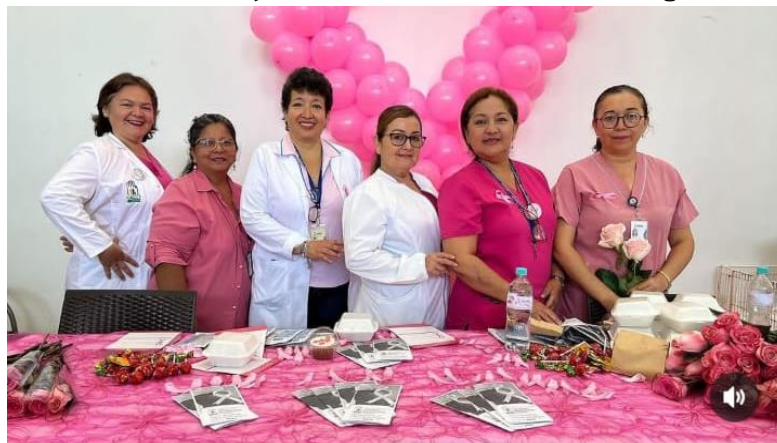
Elaboración: Hospital Teodoro Maldonado Carbo