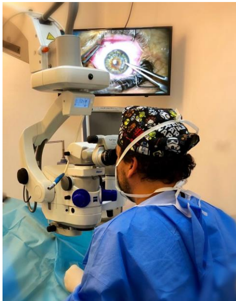
Elaboración: Hospital Teodoro Maldonado Carbo