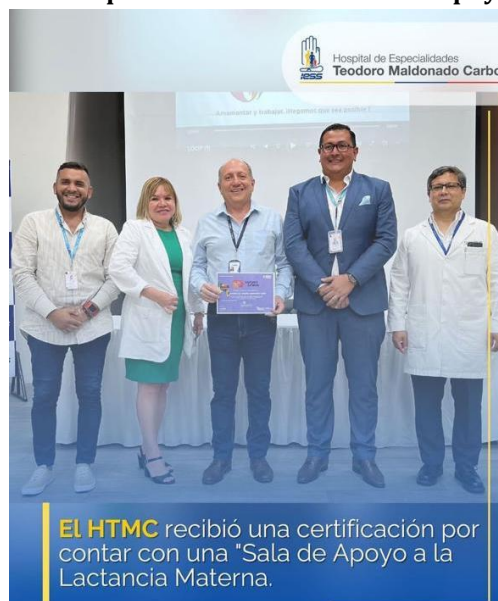
Elaboración: Hospital Teodoro Maldonado Carbo