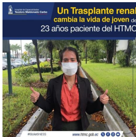
Ilustración Nro. 4 Paciente de 23 año recibe trasplante renal

Elaboración: Hospital Teodoro Maldonado Carbo