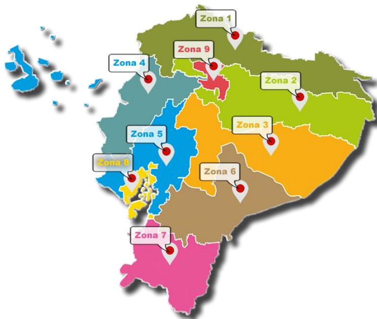
Ilustración Nro. 2 Mapa de Georeferencia 5 y 8