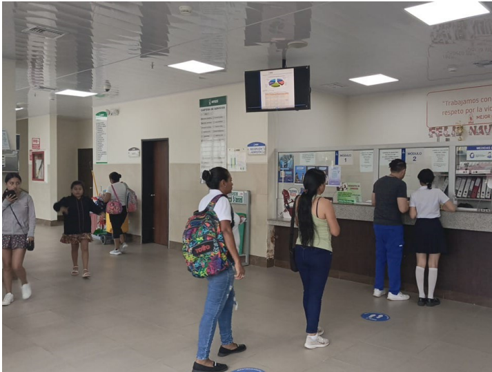
12 de marzo: