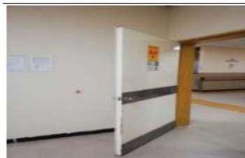
Imagen 11: Evaluación del Plomado de Sala 1 de Imagenología

Se trabajó conjuntamente con las áreas en la elaboración del Plan Médico Funcional 2023, que resalta la gestión en los avances para la Licencia Radiológica que incluye plomado de puertas de Quirófano y sala de Imagenología, así también como las escaleras de evacuación al lado norte de la estructura del edificio.