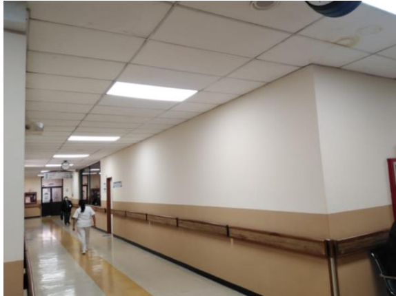
Imagen 10: Iluminación de Consulta Externa.

Se realizó el cambio de luminarias en el Área de consulta externa del Hospital General - Ambato