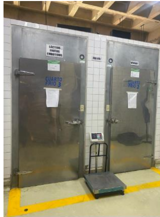
Imagen 7: Mantenimiento correctivo de cuartos fríos Área de Nutrición y Dietética