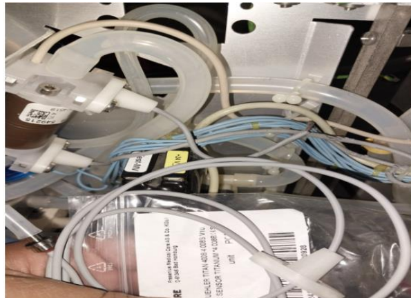
Imagen 6: Mantenimiento correctivo y preventivo de equipos de Diálisis.