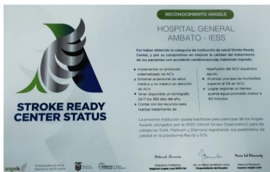
Imagen 14: Imagen del Reconocimiento Angels

El Hospital General Ambato recibió el Reconocimiento Angels, por haber obtenido la categoría de Institución de salud Stroke Ready Center, y por su compromiso en mejorar la calidad del tratamiento de los pacientes con accidente cerebro vascular.