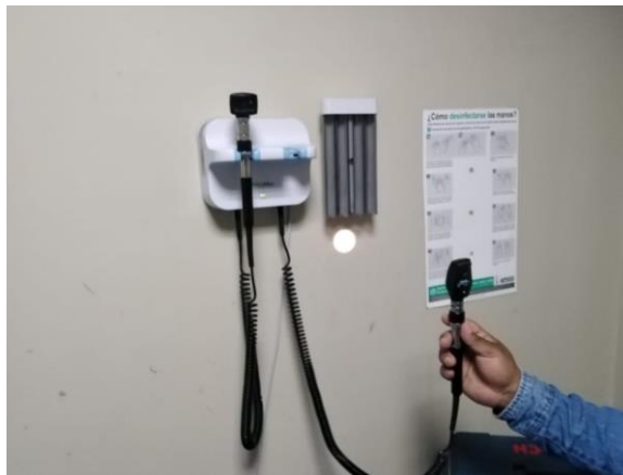
Imagen 9: Focos para los set de diagnóstico del Área de emergencia

Por otro lado, se realizó la compra de focos para los set de diagnóstico del Área de emergencia facilitando así la labor del personal médico.