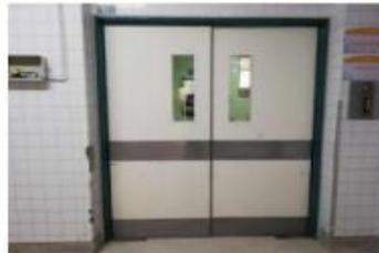
Imagen 12: Evaluación del Plomado de centro quirúrgico

Además se inauguró el servicio de Dosis Unitaria y Atención Farmacéutica en el Hospital General Ambato, nueva prestación que brinda esta casa de salud para que los afiliados mantengan un uso correcto y adecuado de los medicamentos, recetados por los médicos de las distintas especialidades de esta unidad.