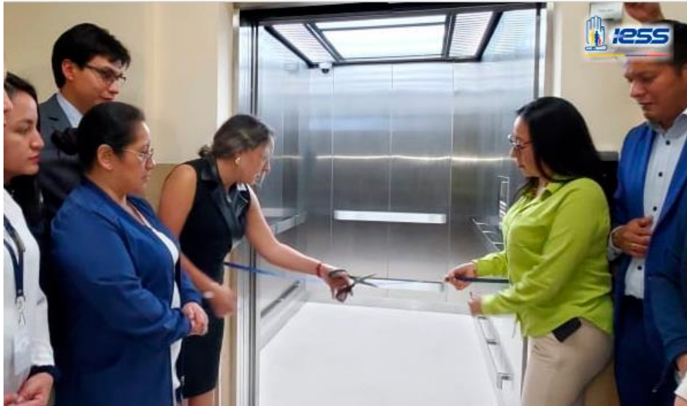
Imagen 1: Inauguración de ascensores nuevos Hospital General Ambato

Además se ha realizado el mantenimiento correctivo y preventivo de los equipos médicos e industriales, contribuyendo al óptimo funcionamiento de los diferentes servicios entre los cuales destacan: