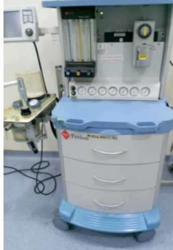
Imagen 4: Mantenimiento correctivo y preventivo de máquinas de Anestesia.