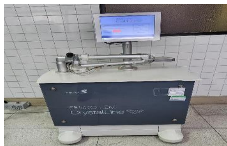
Imagen 3: Mantenimiento correctivo y preventivo de equipos de oftalmología

*Quirófano (mantenimiento correctivo y preventivo de máquinas de anestesia)