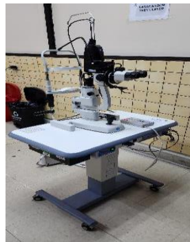
Imagen 2: Mantenimiento correctivo y preventivo de equipos de oftalmología

*Oftalmología (mantenimiento correctivo y preventivo de equipos, compra de repuestos y accesorios).