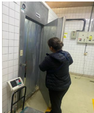
Imagen 8: Mantenimiento correctivo de cuartos fríos Área de Nutrición y Dietética

Por otro lado, se realizó la compra de focos para los set de diagnóstico del Área de emergencia facilitando así la labor del personal médico.