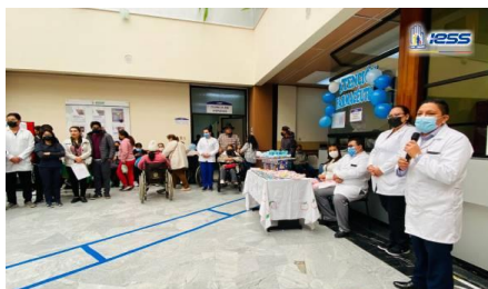
Imagen 13: Inauguración atención farmacéutica

Además se inauguró el servicio de Dosis Unitaria y Atención Farmacéutica en el Hospital General Ambato, nueva prestación que brinda esta casa de salud para que los afiliados mantengan un uso correcto y adecuado de los medicamentos, recetados por los médicos de las distintas especialidades de esta unidad.