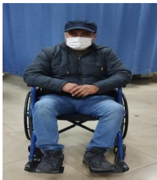
Imagen 15: Imagen sillas de ruedas

Se compró sillas de ruedas pediátricas, para adultos y personas con obesidad ayudando a la movilidad, accesibilidad e inclusión a las distintas áreas de esta Unidad.