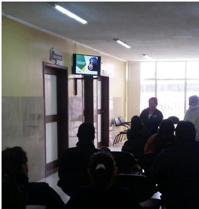
Fuente: Sala de espera planta baja (Afiliados siendo socializados )