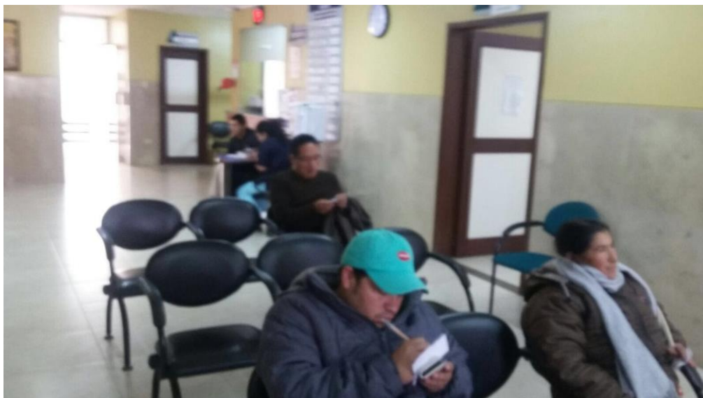
Fuente: Sala de espera planta baja (Recibiendo Aportes ciudadanos )