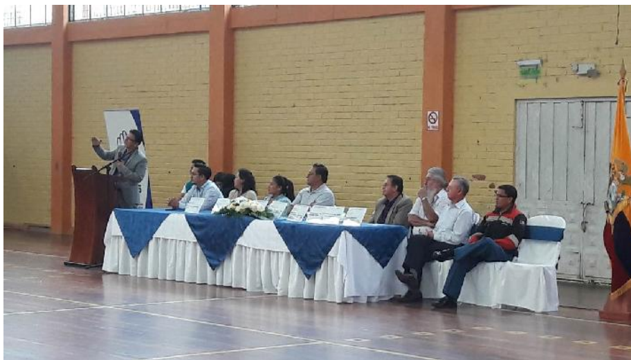
Fotografía 5 Encuentro Provincial de Jubilados 2016