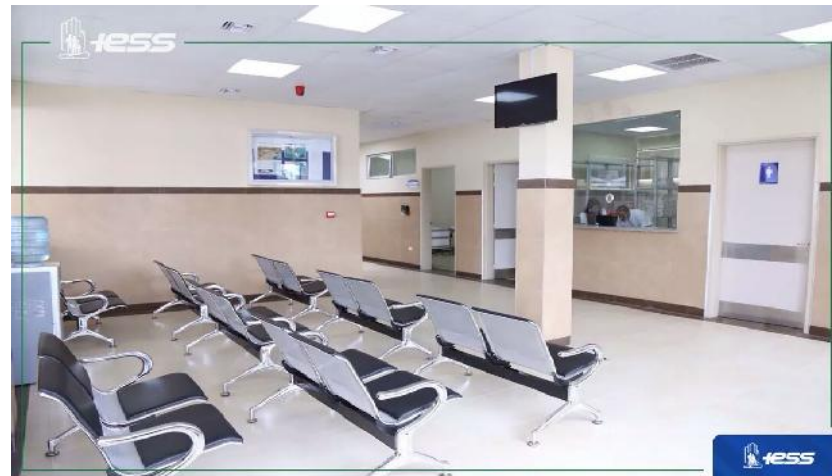
Fotografía 3. Sala de Espera Dispensario SSC San Isidro