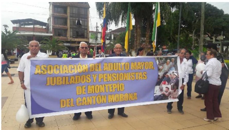
Fotografía 4 Encuentro Provincial de Jubilados 2016

Se ha fortalecido al grupo de adulto mayor, gestionando mediante convenios con el Municipio de Morona y la Federación Deportiva de Morona Santiago, la dotación de un local, así como instructores de gimnasia, natación, baile y canto.