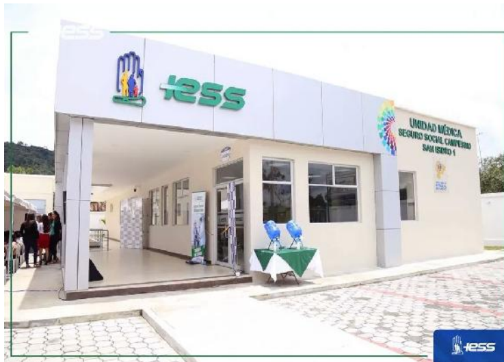
Fotografía 1. Fachada Dispensario SSC San Isidro

El logro emblemático del año 2016 es la construcción del Dispensario Médico San Isidro 1 Tipo AAA: