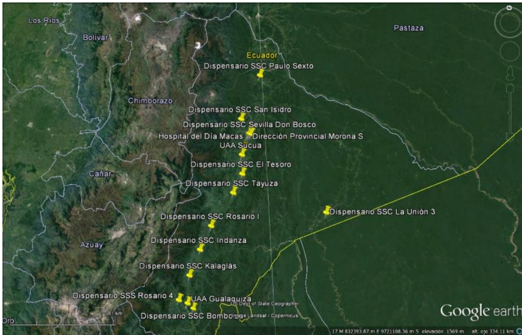
Ilustración 2. IESS Morona Santiago. Cobertura