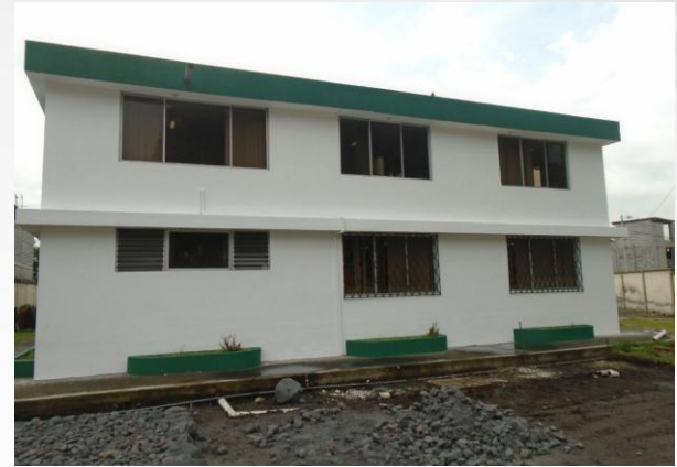
Obras en ejecución en 6 Centros de Adultos Mayores