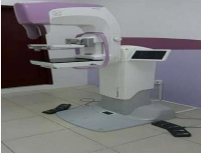
Adquisición de un Mamógrafo