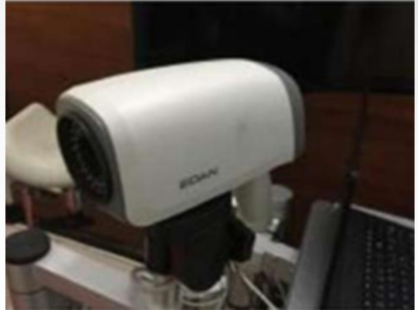
Adquisición de un Equipo Médico Colposcopio