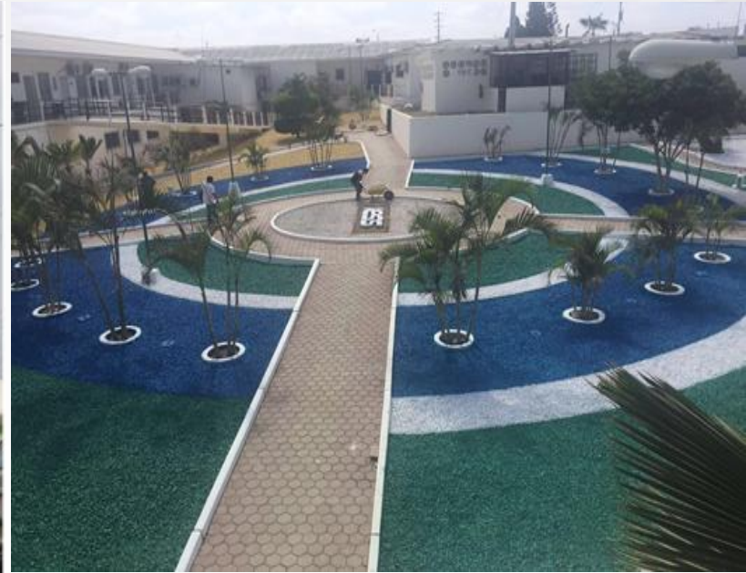
Remodelación Hospital Básico de Ancón