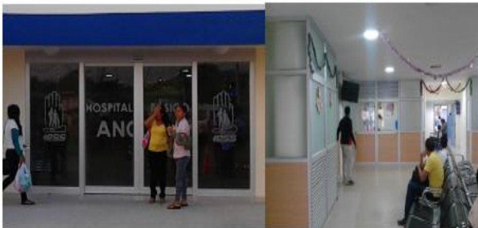
Adecuación, modernización y ampliación del ingreso principal del Hospital Básico Ancón