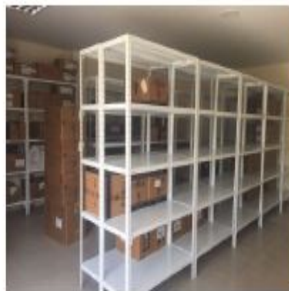
Adecuación, redistribución y ampliación del ingreso principal y la Farmacia del Hospital Básico Ancón